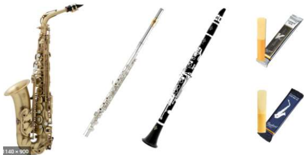
Saxophone, Flute traversière, Clarinette

Ventes d'Anches (à prix coutant) pour les saxophones et les clarinettes.